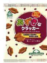
あずきなクラッカー