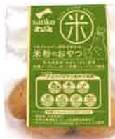
7大アレルギー原料を使わない米粉のおやつ