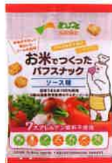
お米でつくったパフスナック ソース味