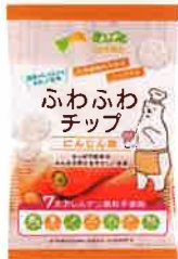
ふわふわチップ にんじん味