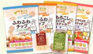
7大アレルギー原料不使用