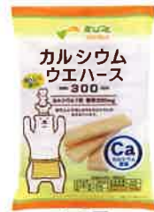
カルシウムウエハース300