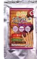
カリッツェル 紫さつま芋&メープル