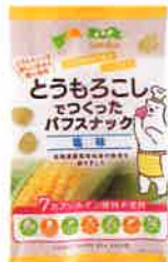
とうもろこしでつくったパフスナック 塩味