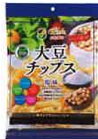
大豆チップス 塩味