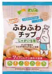
ふわふわチップ じゃがいも味