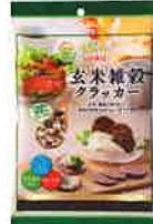
玄米雑穀クラッカー