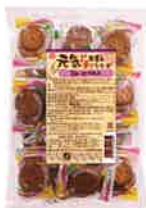
元気 ミレービスケット

毎日食べたいおやつだから、より安全なもの。心の栄養は、おいしく楽しい食生活が一番です。パッケージも園や施設で利用しやすい個包装、アレルギー表示が見やすくつづらけしい。