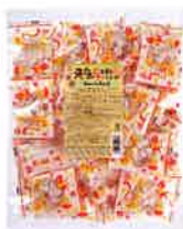
元気 フルーツラムネ