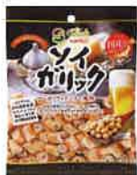
ソイガリック ガーリックバター風味