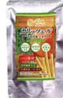
カリッツェル 玉ねぎ&パセリ