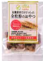
有機素材だけでつくった全粒粉のおやつ