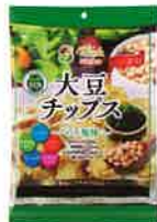
大豆チップス のり塩味